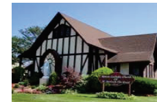
336 Beach 38th Street Far Rockaway, N.Y. 11691