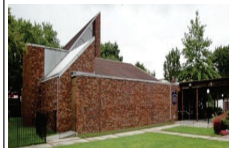
1920 New Haven Ave. Far Rockaway, N.Y. 11691