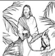
Blessed is he who comes in the name of the Lord.

Father, may our Lenten observance prepare us to embrace the paschal mystery and to proclaim your salvation with joyful praise. Amen.