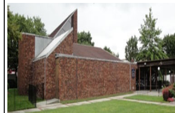
1920 New Haven Ave. Far Rockaway, N.Y. 11691