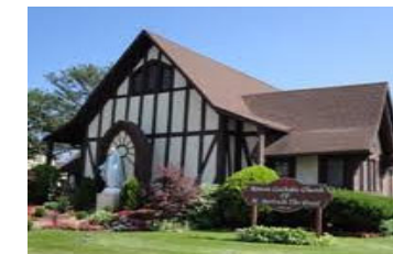
336 Beach 38th Street Far Rockaway, N.Y. 11691